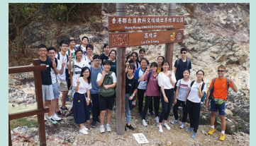
「聆聽心靈的脆弱」項目之戶外活動

未來有賴年青人的承傳與開創，「突破」會繼續聆聽、同行，守望我城，一起領受並經歷從上而來的仁愛、真實和盼望！